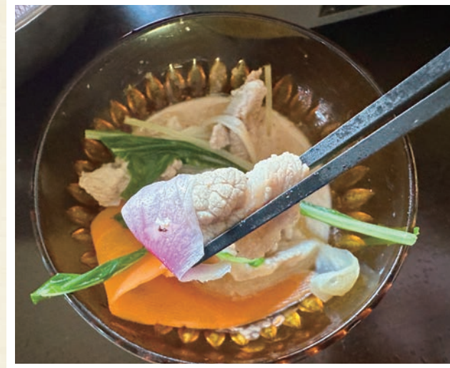
▲花びらは例えるならオクラとレタスをあわせたような味わい。豚肉に花びらをまいて、ごまだれにつけて食べるとおいしいです。生でも食べられます。

昔の人の知恵に学びつつ、今風にアレンジしたあそびをご紹介します。木とあそぶ体験がきっかけで、身近な木とともだちのような関係になれるかも。みどりを大切に思う気持ちがあなたの心に芽生えますように。