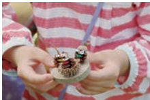
ゆかいな表情がかわいい「木の実で工作」。