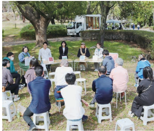
公園つかう座談会の様子。

サクラのつぼみが膨らむ千里南公園で開催した「公園『つかう』座談会」。市内の公園でマルシェなどのイベントを主催された方々と、吹田市公園みどり室、はなみどがそれぞれの思いを語り共有しました。参加された方々からの質問タイムもあり、公園を使用するにあたって大変だったところや、良かったところ、これからの展望など実際のお話を聞くことができました。はなみどでは、「すいた公園『つかう』プロジェクト」として、公園を使用する際の申請方法やアドバイスなどを行っています。みなさんも公園を『つかう』ことにチャレンジしてみませんか。