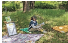
おすすめの植物絵本を集めた「みどりの絵本コーナー」。