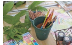
葉っぱの模様をカラフルに写し取る「葉っぱでこすりだし」。