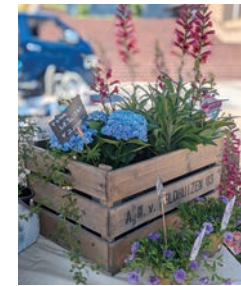
ガーデナーおすすめの花苗などを販売。

「はなみど」が、市内の公園におでかけ出店するポップアップイベントです。今年度はメイシアター前のいずみの園公園に出張します。草花