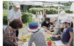
草花や木などを五感で楽しむワークショップコーナー。